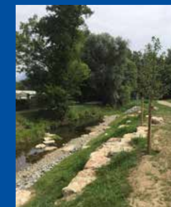
Parco del Lavaggio