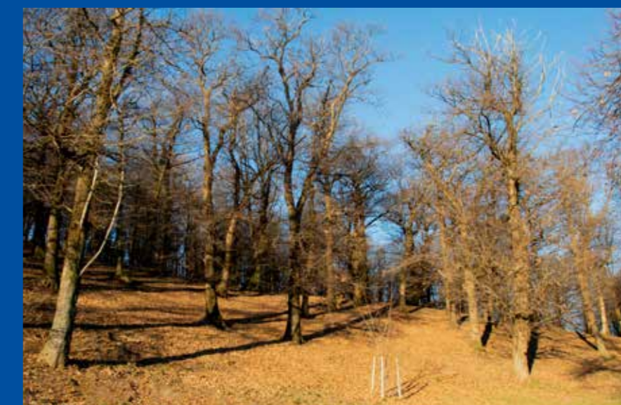
Salvaguardia e valorizzazione della selva castanile