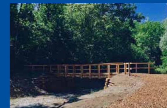
Passerella in legno, Gaggiolo