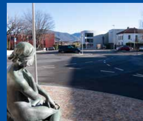
Nuova Piazza Solza