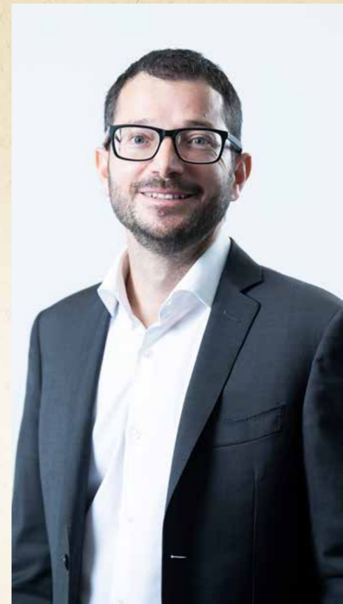
Simone Castelletti, Sindaco di Stabio

Care concittadine e cari concittadini, conto su di voi, non solo il prossimo 14 aprile, quando spero vorrete riconfermarmi la vostra fiducia, ma anche dopo. Perché per migliorare la qualità di vita e il benessere di tutta la cittadinanza occorre impegnarsi con responsabilità quotidianamente e non solo in periodo elettorale. Io sono pronto ad essere ancora il sindaco di tutti, ad affrontare una nuova legislatura con la stessa energia, passione, determinazione e attenzione nei confronti di tutti voi. Vi garantirò ancora il mio massimo impegno, non solo in questo momento di votazioni. Grazie per il sostegno.