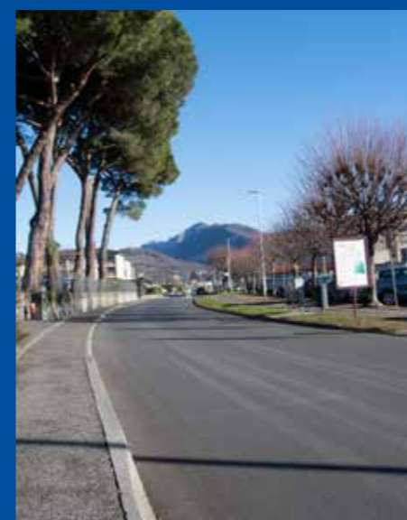
Rifacimento Via Ligornetto